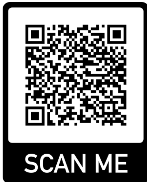
คู่มือกรีฑา