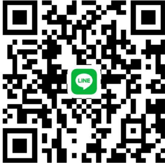
กลุ่มประมวลผลกรีฑา